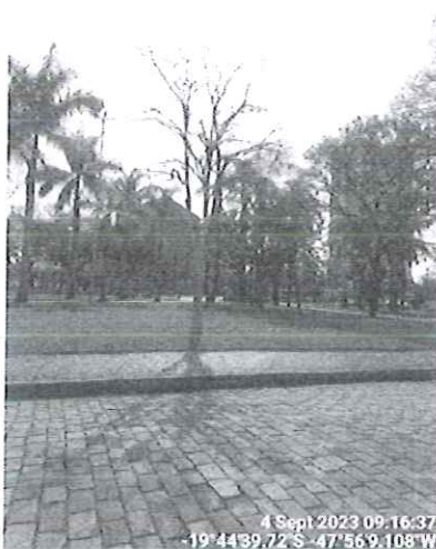
Figura 1 – Vista dos espécimes.

Diante da situação, recomendamos o desmonte do espécime e encaminhamos a presente solicitação para a Secretaria de Serviços Urbanos e Obras para conhecimento e execução.